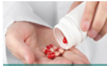
CÔNG NGHỆ BẢO CHẾ DƯỢC PHẨM

Nhờ có kiến thức sâu rộng cũng như kinh nghiệm cá nhân trong các ngành công nghiệp cụ thể, đội ngũ chuyên gia của chúng tôi có thể hiểu nhu cầu của khách hàng và cung cấp các giải pháp cụ thể để tạo lợi ích kinh doanh tối đa cho khách hàng.