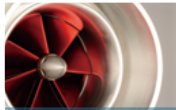
CÔNG NGHỆ GIA CÔNG KIM LOẠI