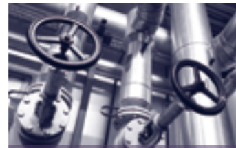
NGÀNH DẦU KHÍ