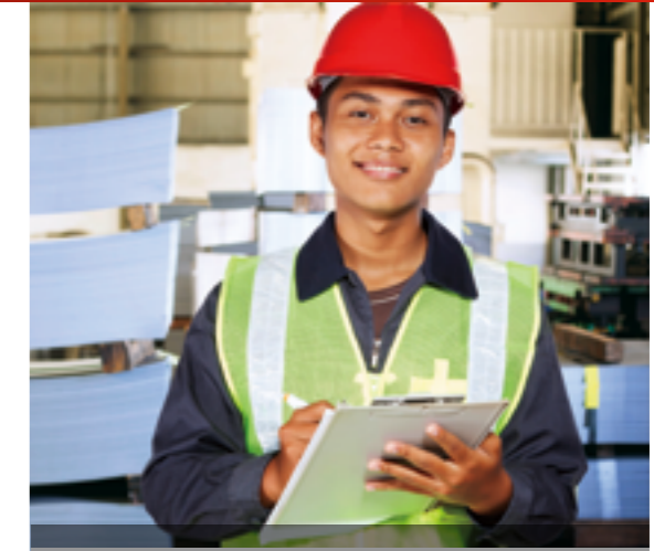
DỊCH VỤ KỸ THUẬT

Bảo trì là một phần trong dịch vụ chăm sóc khách hàng của Rieckermann nhằm đảm bảo máy móc của khách hàng hoạt động tốt và giảm thiểu thời gian dừng máy.