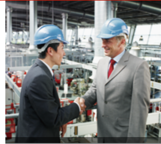
MÁY MÓC THIẾT BỊ

Chúng tôi tìm kiếm và cung cấp các máy đơn lẻ, các dây chuyền xử lý và các hệ thống tích hợp để đáp ứng từng yêu cầu riêng của khách hàng.