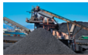
CÁC CÔNG NGHỆ ĐẶC THÙ