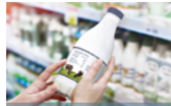
GIẢI PHÁP VẬT LIỆU BAO BÌ