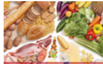
CHẾ BIẾN THỰC PHẨM