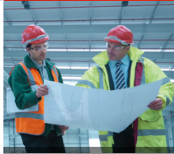
THIẾT KẾ KỸ THUẬT

Khách hàng có thể chọn và kết hợp các dịch vụ tùy theo nhu cầu riêng của mình.