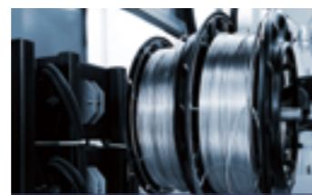
CÔNG NGHỆ SẢN XUẤT DÂY CÁP